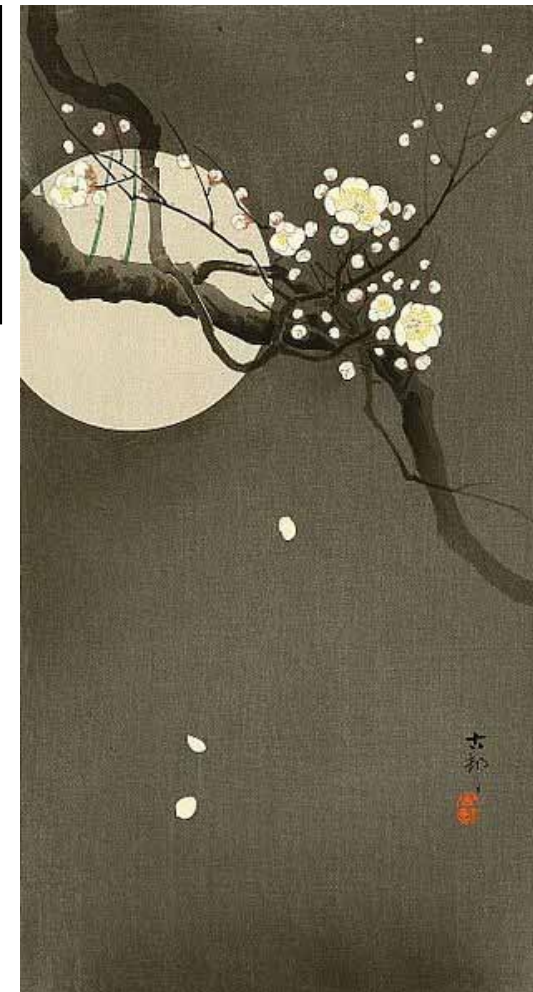
Ohara Koson, Lune et prunier , avant 1945.