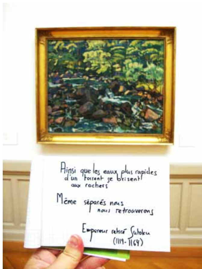
Tanka de l'Empereur retiré Sutoku. Ferdinand Hodler, Ruisseau à Champéry , 1916, Ville de Genève, Musées d'art et d'histoire.

Programme complet ACJ 2019 disponible sur la page Facebook officielle de l'ACJ @automnedelaculturejaponaise